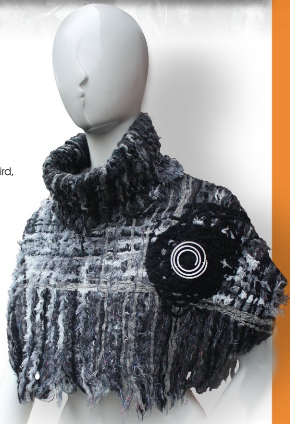
Schnitt: Jeannette Knake www.aktive-handarbeit.de

- jeweils 5-8 cm Zugabe* an Höhe und Breite zuschneiden.