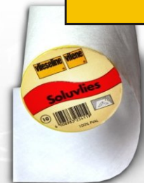
Soluvlies - wasserlöslich