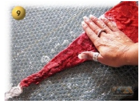
Schritt 9 Das Modell quer zu den Seitenkanten beidseitig je 30 Sekunden rollen. OHNE DRUCK !