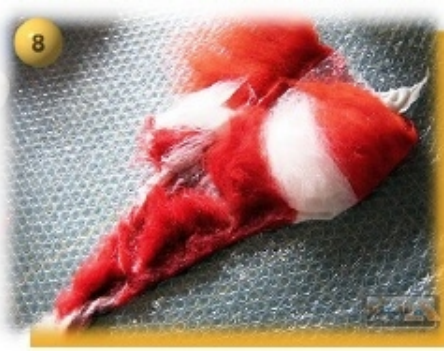
Schritt 8 Überstehende Seitenkanten über der Schablone einschlagen. Hierbei die Streifenfolge beachten. Rot auf Rot etc..