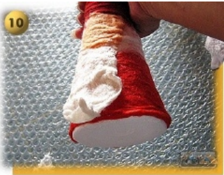
Schritt 10 Modell über den Styroporkegel ziehen und "vor"-modellieren. Anschließend wieder vom Kegel entfernen.