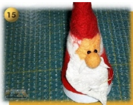
Schritt 15 Nun ist der Weihnachtsmann/Wichtel fertig und wird wieder auf die Styroporform gezogen. Das Trocknen auf dem Kegel, garantiert die gute Standform.