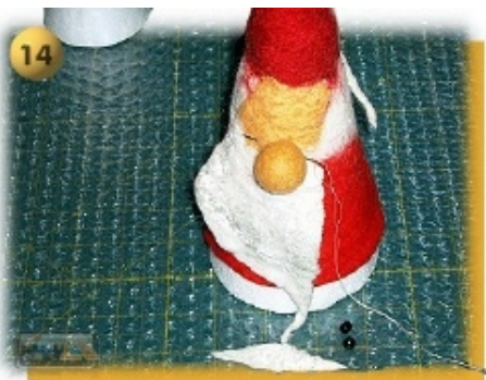
Schritt 14 Für die Montage sind nun alle Gesichtsteile fertig: Nase, Schnurrbart, Augen Mit Nadel und Faden zuerst die Nase, dann den Schnurrbart, abschließend die eng zusammenstehenden Augen annähen.