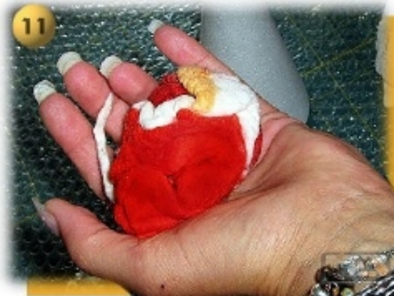
Schritt 11 In die Handfläche legen und ohne Druck ca. 30 Sek. rollen. In Form ziehen und diesen Vorgang wiederholen.