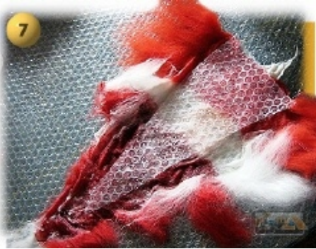
Schritt 7 Modell wenden und Schablone mittig der Filzfläche auflegen. Untere Schablonenkante schließt mit der Modellunterseite ab.