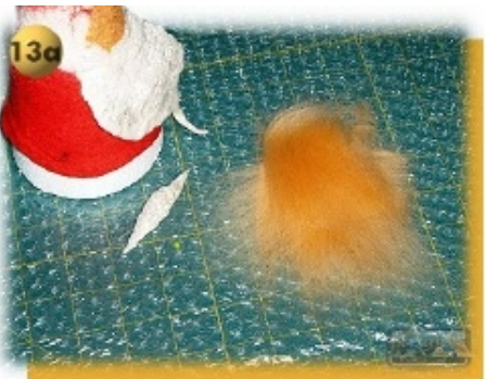
Schritt 13a Die Nase (Kugel) wird mit ca. 4 dünnen Wollschichten (cross) über Kreuz auf die Arbeitsfläche gelegt. Wolle für die Nase in die Handfläche legen u. Trocken, ohne Druck, ca. 10 Sek. rollen. Risse mit hauchdünnen, Neubelegungen bedecken und nochmals rollen.