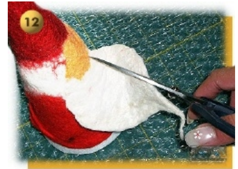
Schritt 12 Modell über den Styroporkegel ziehen und in Form bringen. Bart breiter ziehen, mit der Schere eine ca. 2cm lange und 0,8cm breite kleine Fläche abschneiden (Schnurrbart). Enden der Schurrbartfläche mit den Fingern rollen.